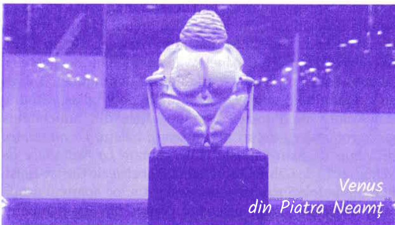
Venus din Piatra Neamț

Oferim câteva fragmente sugestive despre Venus: