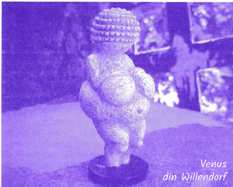
Venus din Willendorf

Franța, din fildes, datată de acum 27000 de ani, Venus din Laussel, Franța, de acum 27000 de ani, Venus din Willendorf, Austria, de acum 25000-30000 de ani și „tânăra” Venus din Piatra Neamț, România, de acum 17000 de ani.